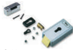
PLA 11 zamek elektromagnetyczny poziomy