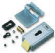
PLA 10 zamek elektromagnetyczny pionowy

inne dodatkowe akcesoria - patrz strony 80 - 87