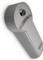
KIO kluczykowe wysprężenie z zewnątrz za pomocą linki