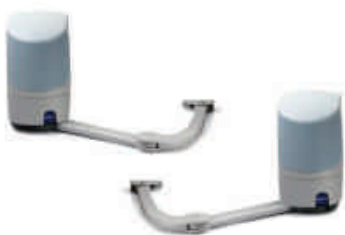
PP7024+PP7224 komplet siłowników