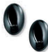
BF fotokomórka (para) zasięg 15-30m