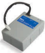
PS124 akumulator 24V 1.2 Ah z wbudowaną kartą ładowania