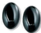
BF 1 komplet fotokomórek